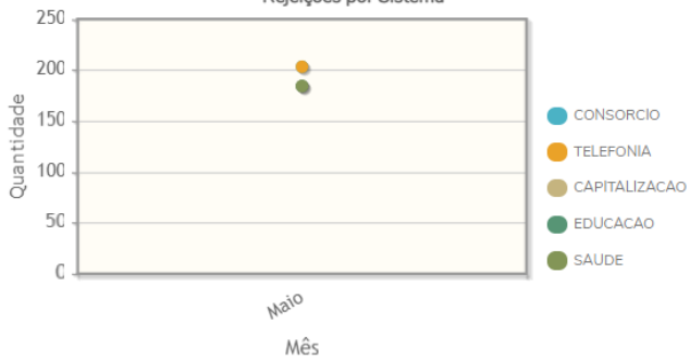
Rejeições por Sistema